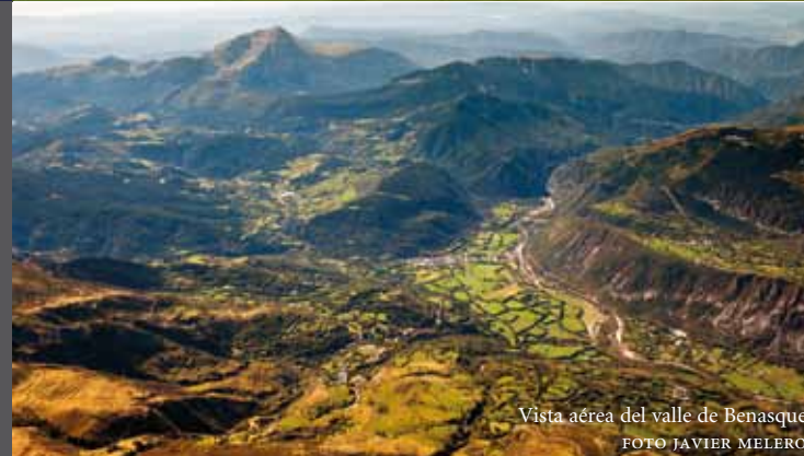
Vista aérea del valle de Bidasoa