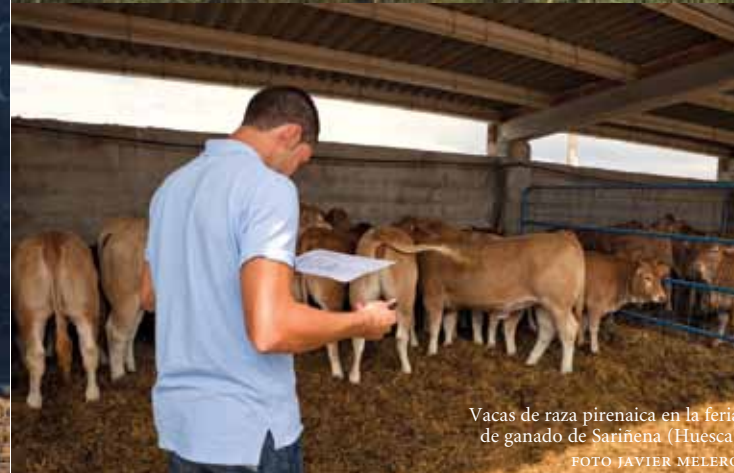
Vacas de raza pirenaica en la feria de ganado de Sariñena (Huesca)