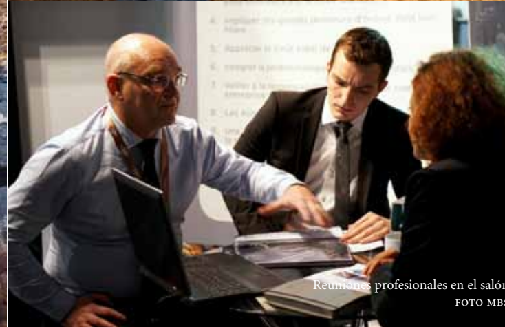
Reuniones profesionales en el salón FOTO MBS