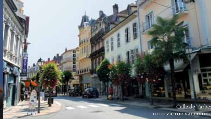
Calle de Tarbes