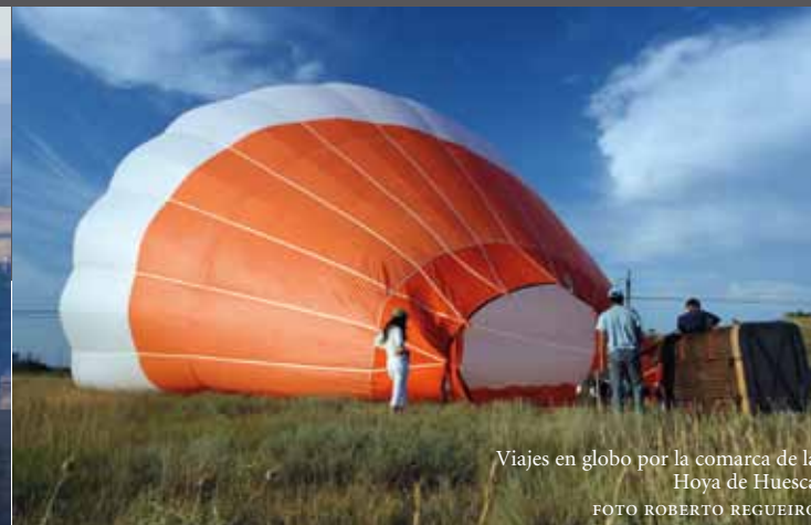
Viajes en globo por la comarca de la Hoya de Huesca