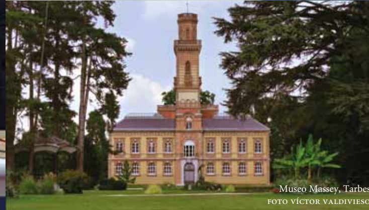
Museo Massey, Tarbes