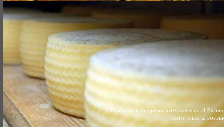
Producción de quesos artesanales en el Pirineo