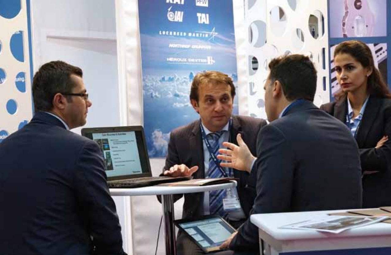
EN ESTA PÁGINA Reuniones profesionales en el salón