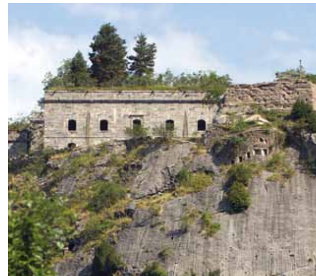
Coll de Ladrones

Los restos del puente de San Antón (dos estribos conservados junto al puente de la Casilla de 1906) y la ermita homónima (posible parroquia de la población medieval de los Arañones y donde pudo existir una posada pública en el siglo XIX) dan acceso al paraje de los Arañones (Canfranc Estación), donde su estación de ferrocarril internacional se asienta sobre el trazado del camino histórico. Este monumental edificio, diseñado por el ingeniero Ramírez de Dampierre, se construye de 1915 a 1925. Su momento de mayor esplendor coincide con la Segunda Guerra Mundial y el de su declive con la supresión, en abril de 1970, de las comunicaciones con Francia. Frente a la estación se encuentra la