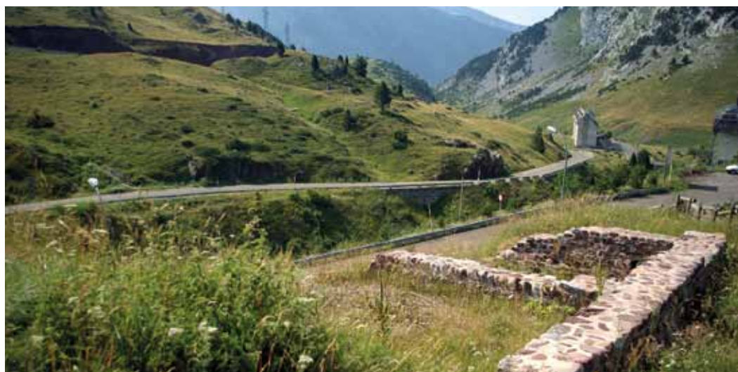
Restos del hospital de Santa Cilia

monjes, palacio prioral, hospital y el mesón, reformado sobre todo en los siglos XVI y XVIII.