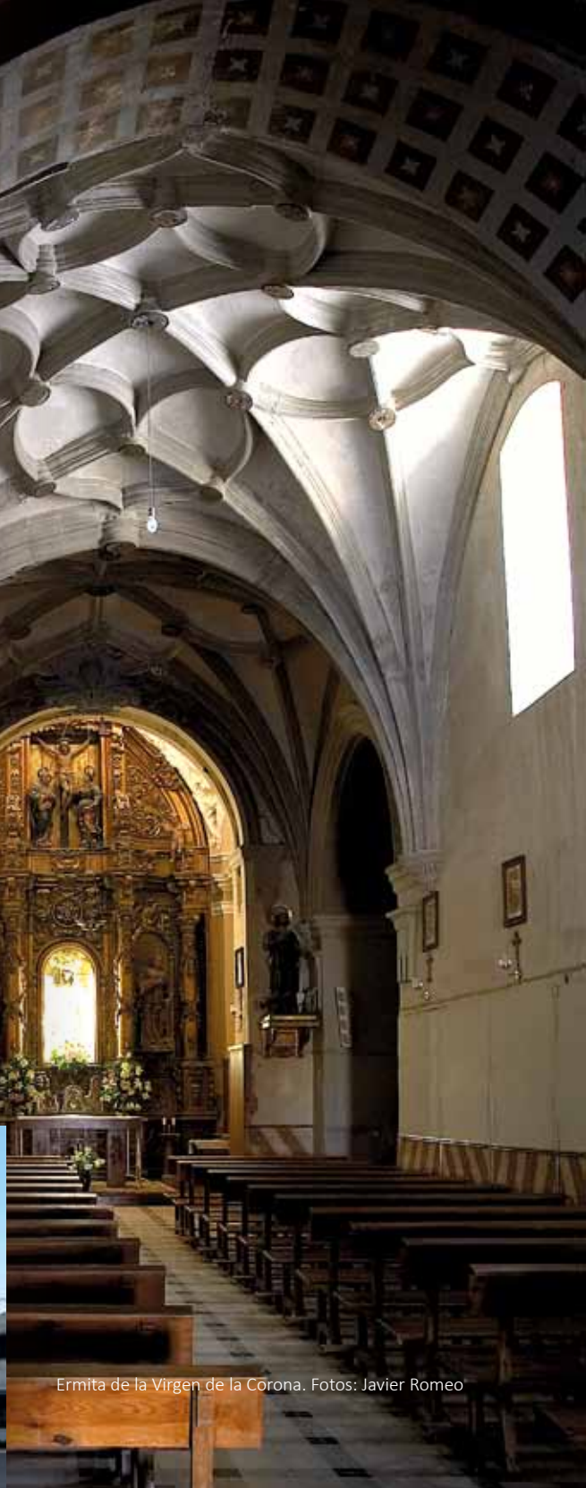
Ermita de la Virgen de la Corona.