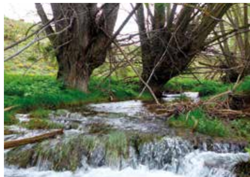
Pequeños rápidos en el río Sollavientos.

Mirlos comunes, petirrojos, zarceros comunes, pinzones vulgares, escribanos soteños, pitos reales, verdecillos, carboneros comunes, currucas zarceras, ruiseñores comunes... y