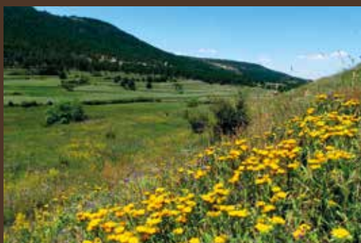
Inula montana en ladera de la val de las Peraltas.

La vista es magnífica hacia el valle del Guadalope, más profundo, en el término de Villarroya de los Pinares como hacia el más somero valle del Sollavientos. Estos ambientes abiertos son apropiados para observar planeando a dos rapaces forestales: el águila calzada y la culebrera europea.