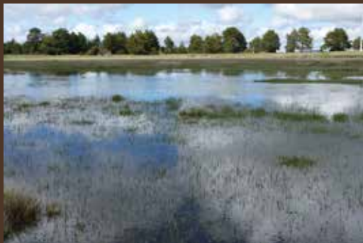
Laguna de la Atalaya.