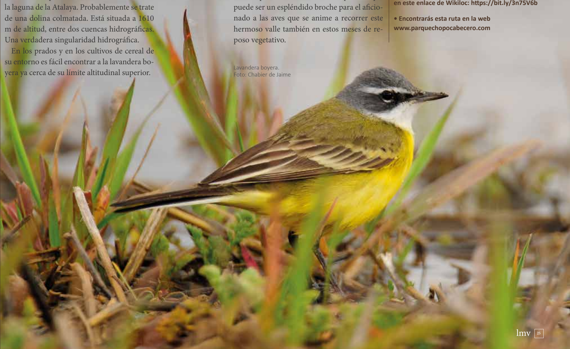
Lavandera boyera.

En estos peñascos, en lo más crudo del invierno, puede verse el acentor alpino lo que puede ser un espléndido broche para el aficionado a las aves que se anime a recorrer este hermoso valle también en estos meses de reposo vegetativo.