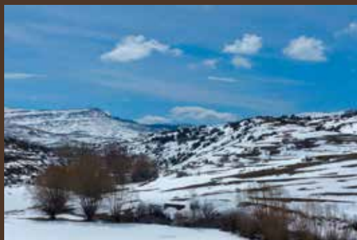
El valle tras una nevada invernal.