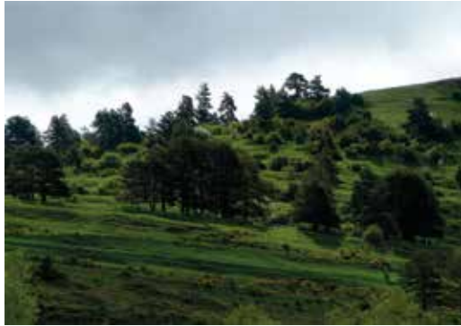
Pinos y arbustos en los prados, tramo de subida

En este ambiente forestal es abundante una especie de gran interés biogeográfico: el verderón serrano. Este fringílido es un endemismo de las cordilleras del suroeste de Europa. Tiene su hábitat en los bosques de coníferas donde se reproduce, alimentándose en las praderas cercanas. En el invierno, es común