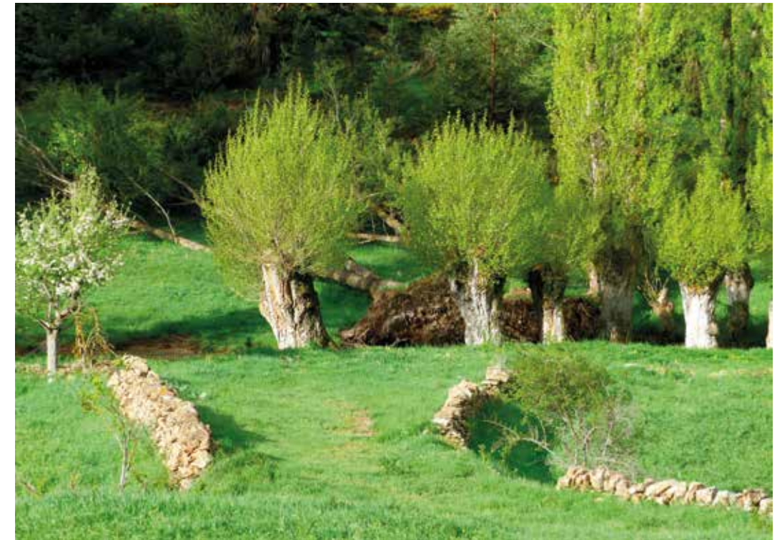
Chopos cabeceros con vigoroso rebrote tras su desmoche.

La masía está recostada en una ladera en solana en la que afloran margas y calizas cretácicas. Las primeras están pobladas por un matorral abierto de aliaga, tomillo y pasto seco en la que no es raro observar tarabilla común o curruca rabilaruga, un pájaro este característico de los matorrales ibéricos de escaso porte. Las calizas forman unos resaltes en cuyos extraplomos cría una veintena de aviones comunes, especie propia de los roquedos que ha conseguido colonizar los edificios de pueblos y ciu-