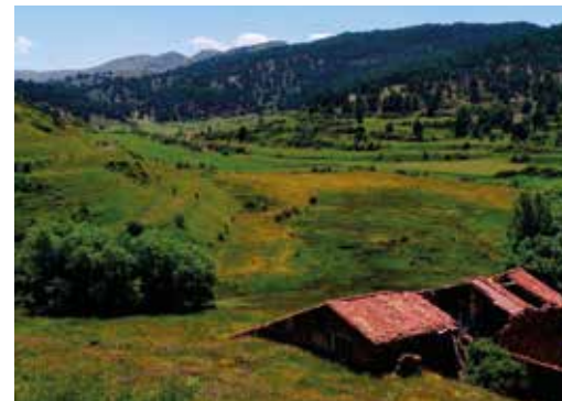
Masía de Peralta Alta.

En estos prados frescos puede encontrarse un pequeño pájaro propio de las zonas litorales y de las amplias llanuras de las principales cuencas hidrográficas: el buitrón (o cisticola buitrón). La presencia de este pequeño pájaro en el Alto Alfambra es otra singularidad bio-