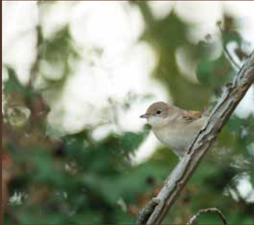
Curruca zarcera.

dades, unos roquedos singulares. Frente a la masía, circula el río Sollavientos, bien jalonado por los chopos y sauces trasmochos, árboles campesinos que definen el paisaje de este