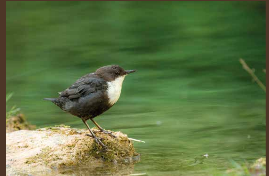
Mirlo acuático Carlos Pérez Naval: Mirlo acuático. Foto: Carlos Pérez Naval

El río Sollavientos es uno de los principales afluentes del río Alfambra. Reúne las características de los ríos de la montaña mediterránea calcárea. Caudal con marcadas irregularidades estacionales y anuales, de aguas muy carbonatadas y oxigenadas, así como con un régimen pluvionival. Hay que vadear el río. Cuando el caudal es escaso no resulta difícil, pero en tiempos de aguas altas conviene descalzarse. Las arenas y gravillas son mayormente fósiles de nummulites.