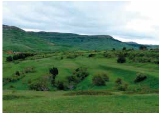
Descenso hacia el fondo del valle.

pequeño barranco por el que se llega al río. El sendero se desdibuja entre el río y las cerradas de las fincas. No tiene pierde. Hay que seguir el curso del agua. Destacan los robustos sauces (sargas, les llaman aquí) y álamos negros trasmochos. Algunos ejemplares son magníficos. El paraje es de una gran belleza.