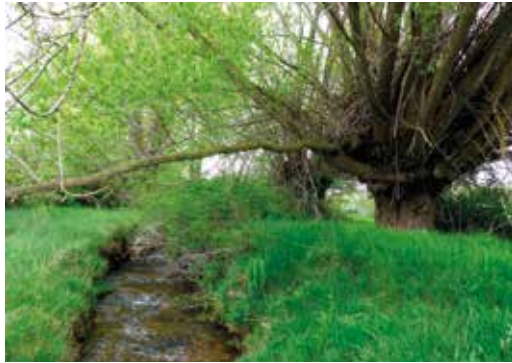
Sarga o sauce trasmocho.

es espléndida mostrando hacia el este y el sur las cimas del Recuenco (1972 m), Alto de la Nave (1977 m) y la Zaragozana (1912 m), entre otros. Desciende después hacia el valle siguiendo la dirección de una larga pared construida con losas de calizas en técnica de piedra seca. Es impresionante.