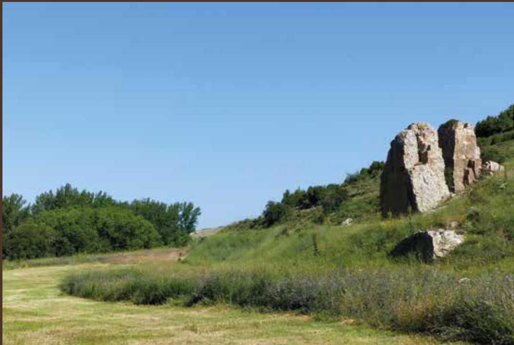
Bloque partido en el fondo del valle.

teño o el carbonero común y para otros migratorios que cada año cruzan dos veces el desierto del Sáhara y el mar Mediterráneo para nidificar en estas montañas, como el zarcerol políglobo o la curruca zarcera, pequeño pájaro más propio de los setos y campiñas atlánticas y centroeuropeas que de los bosques mediterráneos.