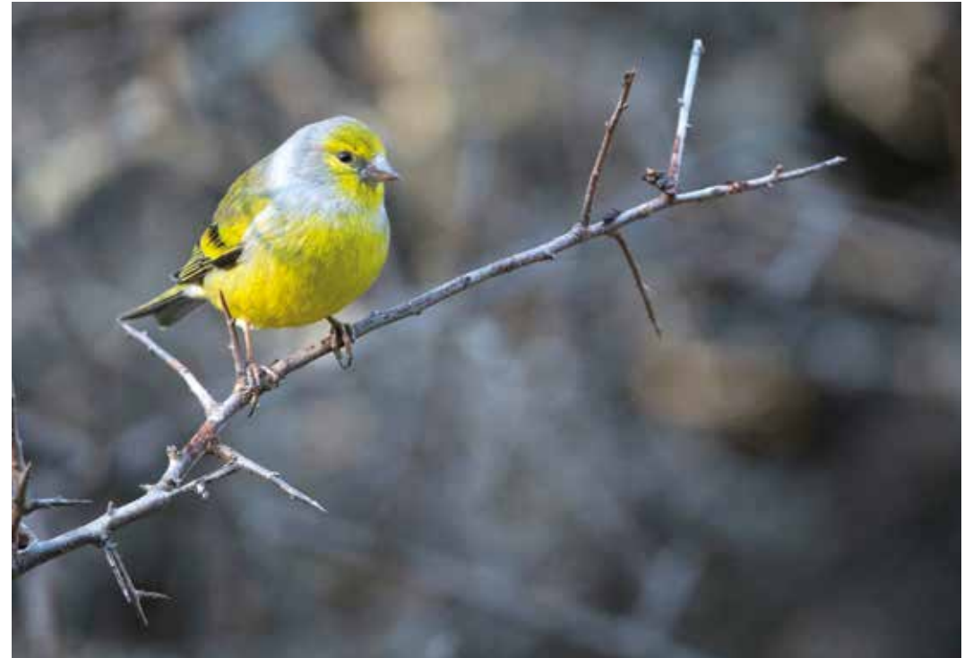
Verderón serrano.

En el espinar, durante el periodo reproductor, es fácil encontrar el mirlo común, el petirrojo y el ruiseñor común. En la invernada