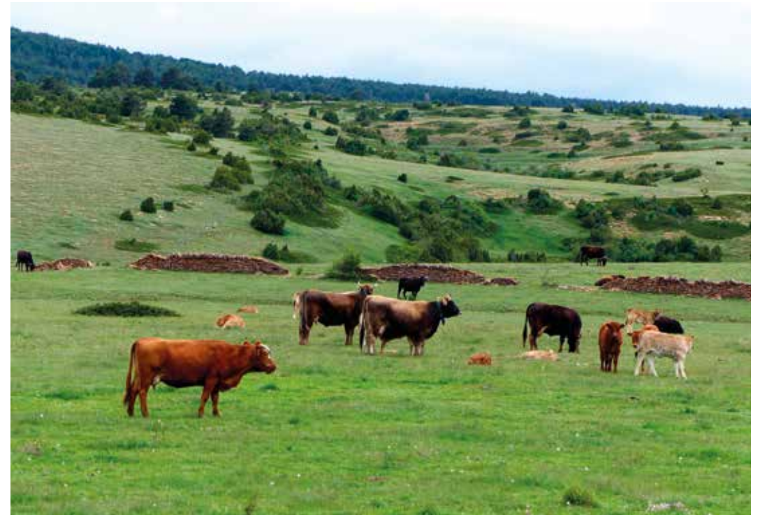
El caminante interrumpe el tranquilo pacer de las vacas.

otros muchos pequeños pájaros hacen sus nidos en esta dehesa fluvial. El cuco, siempre atento, aprovecha el abandono temporal del nido de la hembra de alguna de estos pequeños pájaros para robar un huevo y dejar otro propio en su lugar. El río Sollavientos presenta rápidos y pequeños saltos de aguas que se alternan con tramos de un lecho de menor pendiente en el que llegan a formarse charcas temporales tras periodos de precipitaciones cuantiosas. Estos humedales favorecen el desarrollo de plantas acuáticas y de otras palustres en sus márgenes, una vegetación que se enriquece por la abundancia de arbustos y de gruesos árboles, cuyas ramas caídas forman ambientes de gran interés para la vida silvestre.