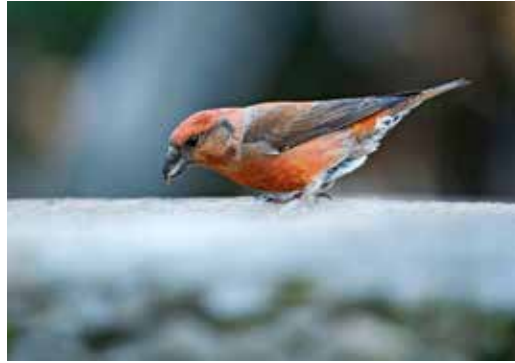
Piquituerto común.

El camino atraviesa pastizales sobre sustratos rocosos y suelos muy erosionados cubiertos por prados muy soleados con enebros y chaparras. Es fácil observar a dos especies de escribecartas, uno sedentario y muy común, el escribano montesino, otro estival y algo más