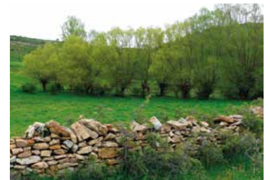
Muro de piedra seca en las Peraltas.

En estos prados frescos puede encontrarse un pequeño pájaro propio de las zonas litorales y de las amplias llanuras de las principales cuencas hidrográficas: el buitrón (o cisticola buitrón). La presencia de este pequeño pájaro en el Alto Alfambra es otra singularidad bio-