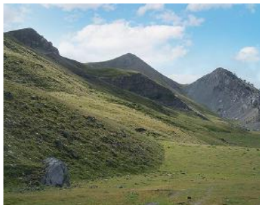
En el centro, el Comodoto

En el valle de Pineta, el Comodoto, con sus 2 355 m de altitud, es una de las montañas más atractivas y asequibles, una cima que regala a quienes la coronan una de las más atractivas vistas. Es una ascensión ideal para ir en familia. Hay varias rutas pero la más recomendable es seguir la senda del GR 11 desde la ermita de Pineta en una ida y vuelta que completaremos en unas 6 horas y media (sin contar paradas), recorriendo 13,3 km. En verano disponemos de una generosa amplia banda de horas de luz, y madrugar, algo siempre aconsejable en las salidas a la montaña, nos permitirá ir bien holgados. ¡Vayamos, pues!