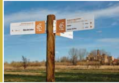
Desde Letux pueden realizarse cuatro rutas de las Aguasvivas y sus afluentes, señalizadas con indicadores como el de la imagen y torre del castillo de Letux