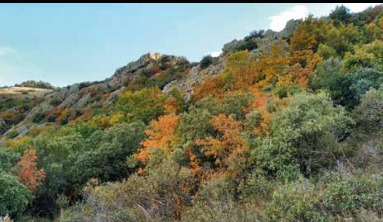
Bosque otoñal en la vertiente oriental del Valdemadera