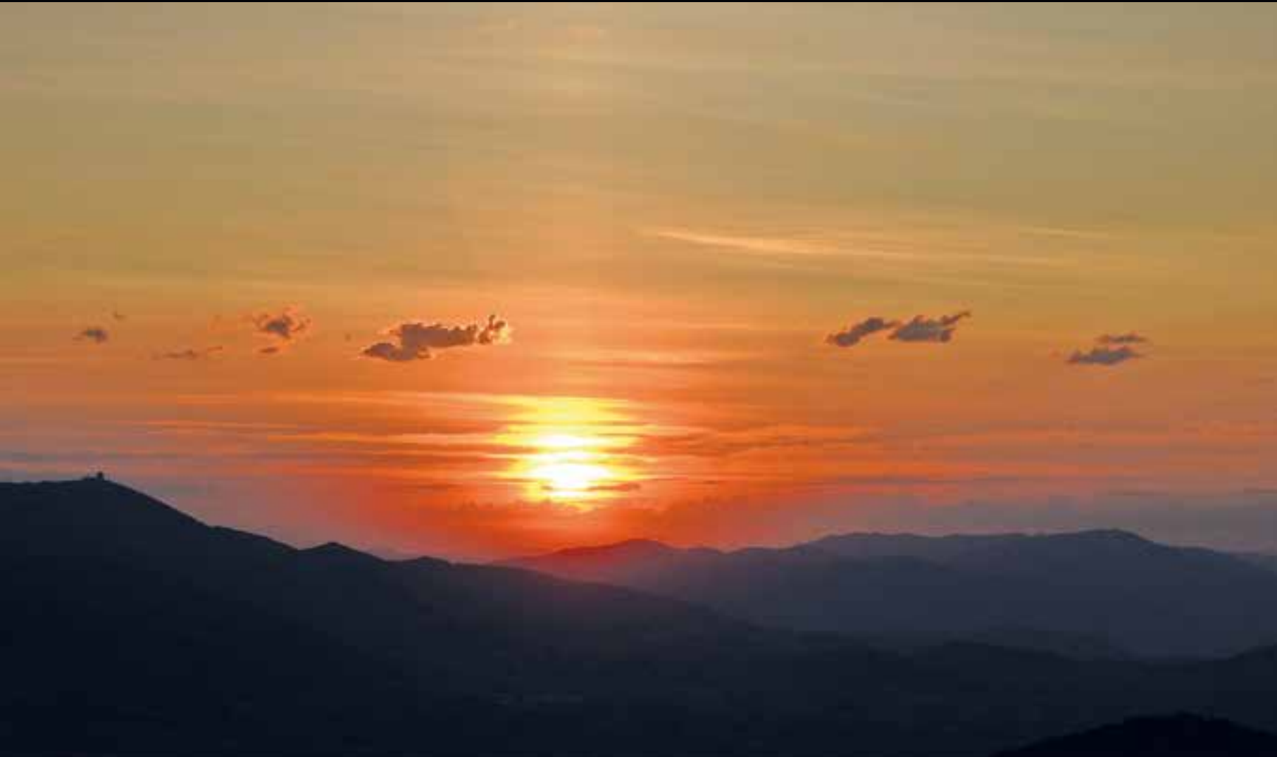
Atardecer desde la cima de Valdemadera

En nuestra anterior entrega ascendimos al cerro del Espino y Peña Sangarba desde Almonacid de la Sierra y en esta ocasión no nos iremos muy lejos. Volvemos a la vertiente oriental de la sierra para afrontar un recorrido que comienza en la agradable área recreativa del Raso de la Cruz, cerca de la localidad de Cosuenda. Desde ese punto ascenderemos a la cumbre del pico Valdemadera o Pelao, que con sus 1273 m es el techo de la sierra de Algairén.