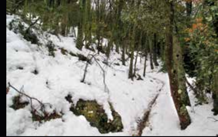
Sendero bajo el collado de Valdecerezo

Continuamos recorriendo el Sistema Ibérico en la provincia de Zaragoza, y regresamos a la sierra de Algairén, surcada por una extensa red de senderos que hacen las delicias de caminantes y amantes del medio natural. También de corredores por montaña que aprovechan la cercanía desde la capital aragonesa y las muchas posibilidades que la sierra ofrece para el entrenamiento.