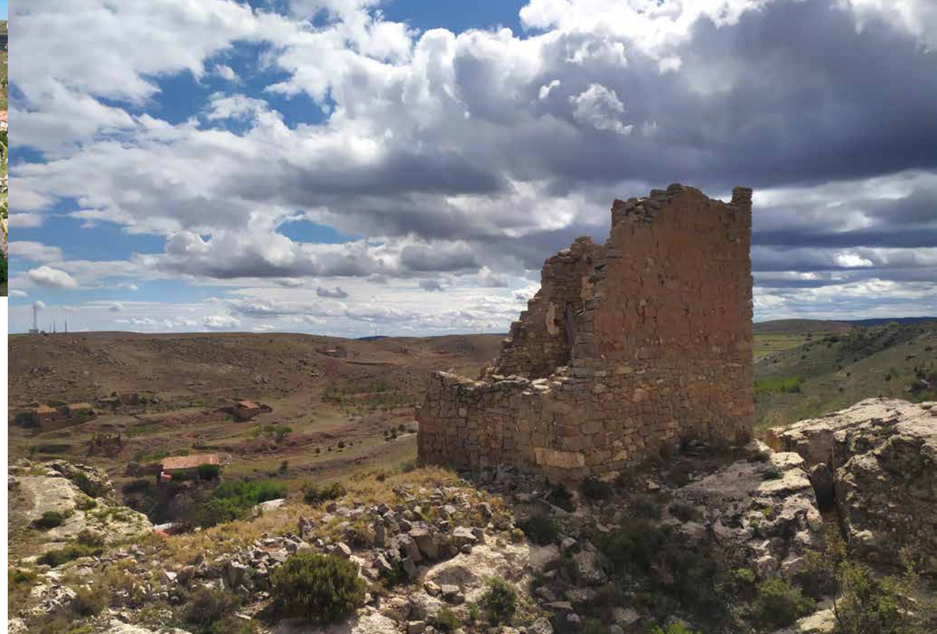
Torre palomar en el cabezo

Maicas está conectada con Huesa del Común, Anadón, Salcedillo y Segura de Baños a través del PR-TE 110 Circular del Aguas Vivas, homologado como Sendero Turístico de Aragón. Es un recorrido de 44 km que acumula un desnivel de 1090 m y puede realizarse en 13 h 15 min (tiempo MIDE, sin paradas). La información detallada sobre este sendero la encontraremos aquí: https://senderosturisticos.turismodearagon.com/ruta/ficha/3370 .