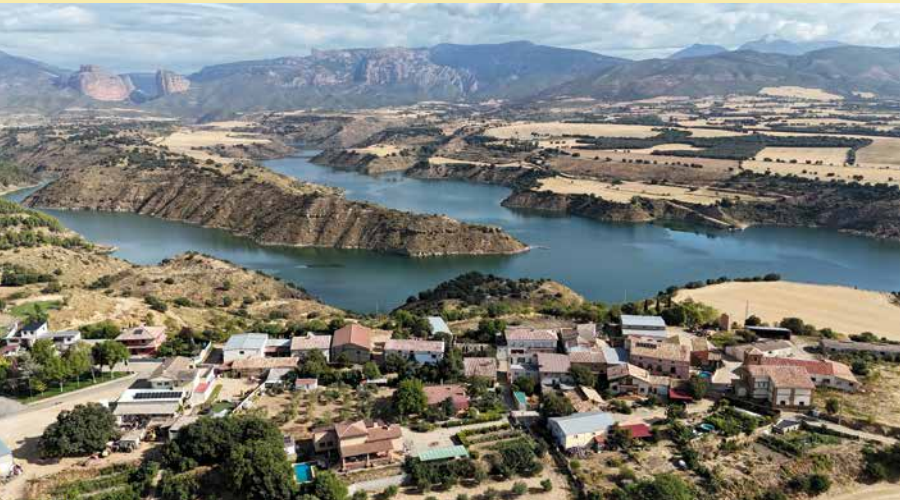
Embalse de Montearagón

La vía Huesca-Fornillos-Apiés tiene un recorrido aproximado de 10 km. En su inicio, en el polígono industrial Monzú, avanza por un camino agrícola entre campos de secano, sin ninguna pérdida. A 1 km del inicio, el paisaje se abre con buenas vistas hacia el castillo de Montearagón (E) y a la peña Gratal (O). A unos 3,5 km del comienzo empieza una subida que ya se vislumbraba desde el principio del recorrido. Este tramo cementado concentra casi la mitad del desnivel positivo del recorrido. Hacia la mitad de la ruta llegaremos a Fornillos, donde podremos descansar en un parque con sombra y acercarnos a ver el embalse de Montearagón, con asombrosas vistas del Prepirineo.