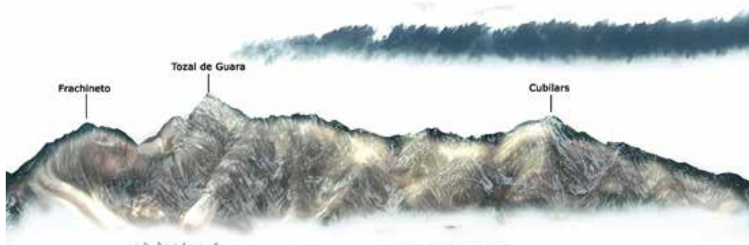
Representación artística de la Giganta que conforma el perfil de la sierra de Guara. Diego Vázquez Prada

Según estudios del Instituto de Estudios Altoaragoneses, este territorio alberga una de las mayores concentraciones de «espacios sagrados» de Europa. Y la piedra, en todas sus formas y edades, es su fundamento.