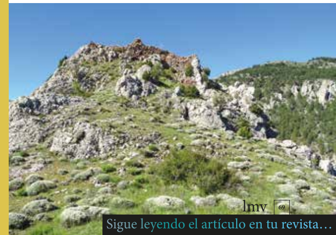
Derecha, emplazamiento de la antigua iglesia parroquial, que servía de cierre del flanco septentrional del conjunto defensivo de Camarena, el enclave más meridional y efímero de la mitra de Zaragoza

Tras la creación del Obispado de Teruel (1577), parte de los territorios de la mitra de Zaragoza quedaron incluidos dentro de sus límites episcopales. Pero, a pesar de la disociación entre límites diocesanos y señoriales, el Arzobispado de Zaragoza siguió ejerciendo la gestión económica y jurisdiccional de los mismos. El señorío se mantuvo hasta su abolición en el siglo XIX.