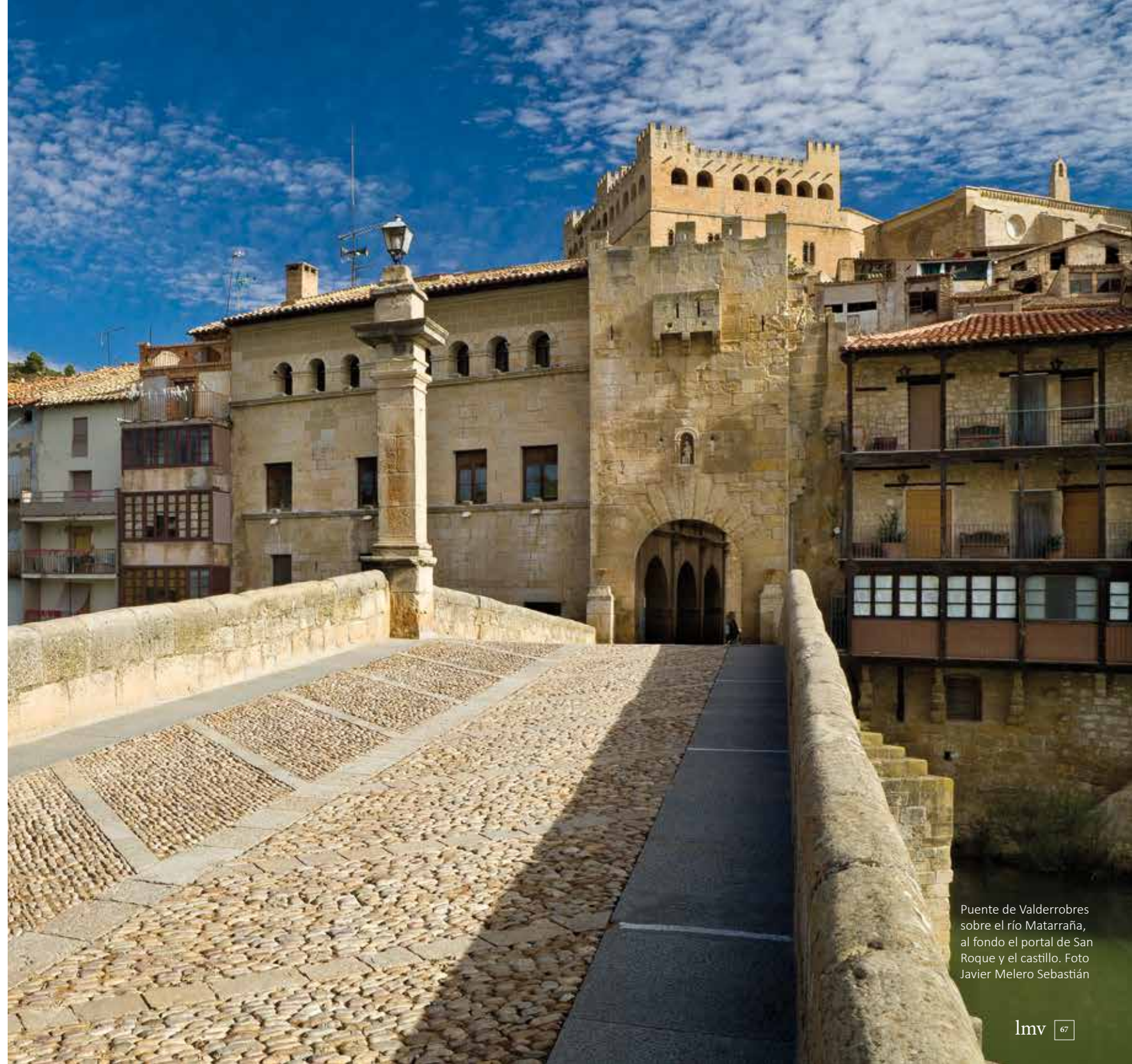
Puente de Valderrobres sobre el río Matarraña, al fondo el portal de San Roque y el castillo.

Textos y fotos (salvo firmadas): Javier Ibáñez González y Rubén Sáez Abad (Centro de Estudios Arcatur / IET)