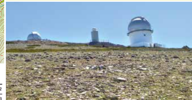
Llegando a la cumbre