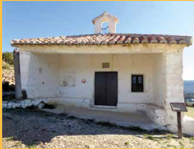
Ermita de San Juanico. Abajo, La Higuera, y Arcos de las Salinas al fondo

Para acceder a él salimos desde La Higuera, una masía perteneciente al término municipal de Arcos de Las Salinas, donde se inician otras, pero de mayor distancia. Partimos, pues, de esta pedanía desde la que nos incorporamos a las señales de un PR, y que en menos de 15 minutos nos hace pasar por la ermita de San Juanico, según reza en la puerta, a donde llega una canalización de la fuente de San Juan, que también visitamos a nuestro paso por ella. Situada en el barranco del mismo nombre, la atravesamos para ir ladeando el monte Carmona e ir entrando sin apenas darnos cuenta en la cuenca de Los Villares, no sin antes dejar por abajo la llamada Casa del Aguabuena.