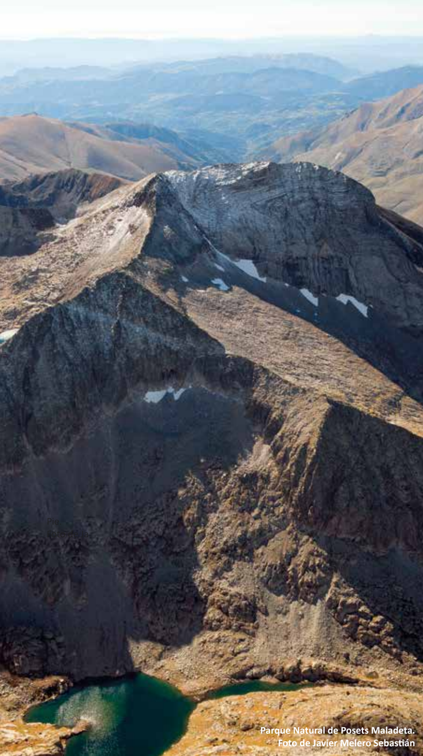
Parque Natural de Posets Maladeta.

PARA SABER MÁS EL PÓDCAST DE MONTAÑA SEGURA