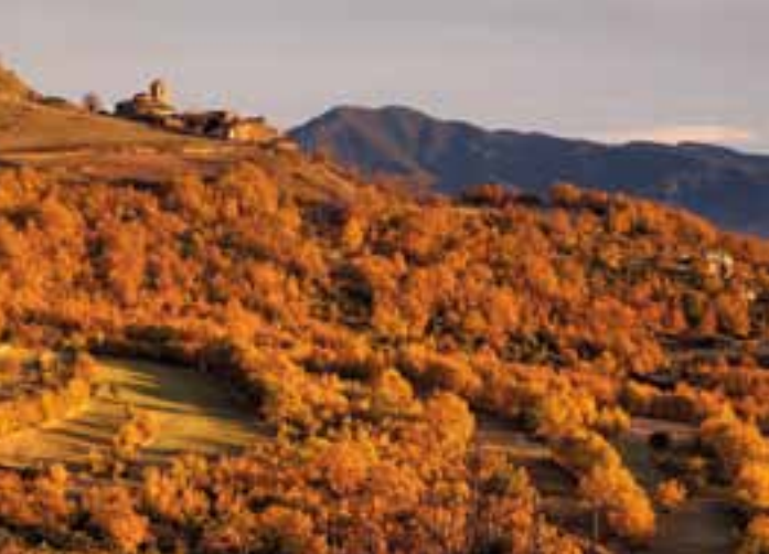
Izquierda. El Pueyo de Araguás, muy vinculado al monasterio de San Victorián.