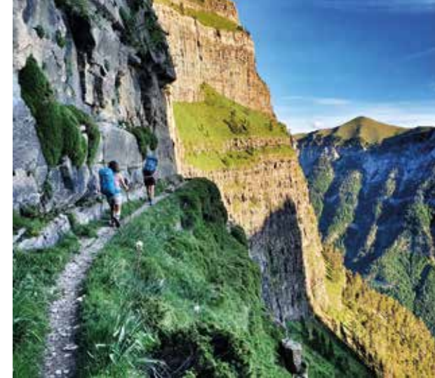
Iniciando el paso de la Fajeta / Faixeta, para evitar las clavijas de Salarons

Por otro lado, en septiembre estamos ya fuera del periodo estival en el que el acceso en vehículo propio a la pradera de Ordesa está prohibido, pero hay que recordar que volverá a estar