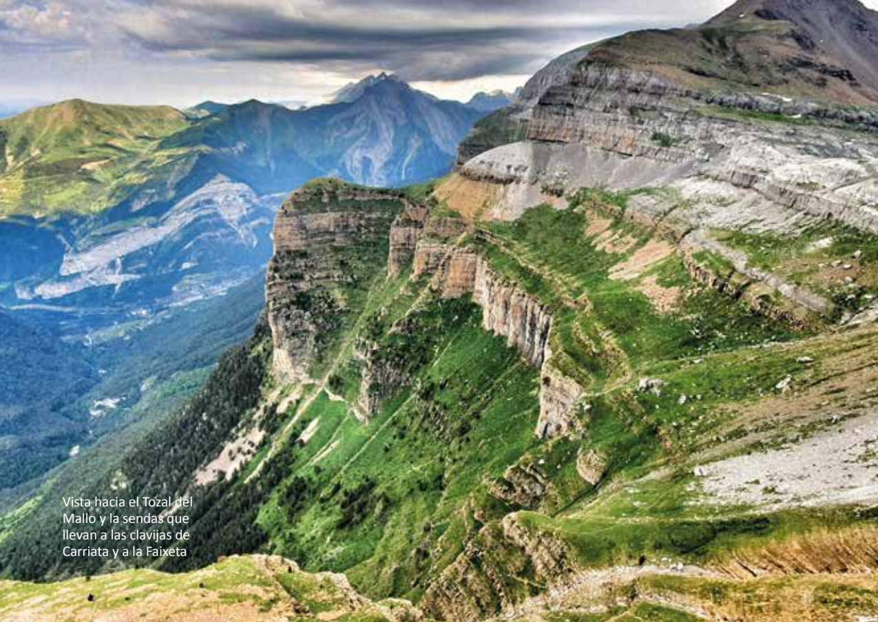
Vista hacia el Tozal del Mallo y la sendas que llevan a las clavijas de Carriata y a la Faixeta