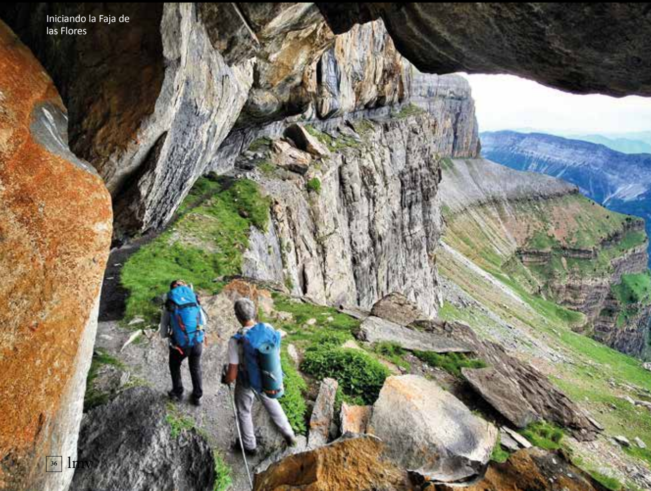
Iniciando la Faja de las Flores

traza un saliente al sur en las paredes del Gallinero y cambia su orientación para continuar en dirección noreste hasta los llanos de Mondarruego, señalados por un gran morrón de piedras. Nos encontramos a 2 350 m de altitud, en el punto donde el sendero SA32 enlaza con el sendero de Cotatuero (SA17), por el que realizaremos el descenso hasta el fondo del valle (3 horas, 4,2 km) a través del expuesto paso de las clavijas de Cotatuero. Si preferimos evitarlo, tenemos la opción de retornar por el camino que nos ha traído hasta aquí. El lugar invita a detenerse, admirar el paisaje, la flora y la fauna del lugar, entre la que será habitual encontrarse con ejemplares de sarríos.