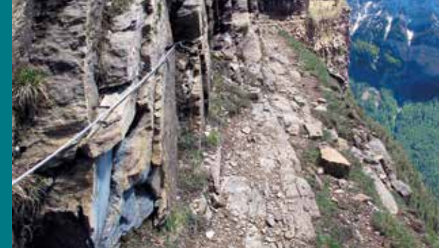
Tramo de la Faixeta equipado con sirga pasamanos.

Tras el paso de la Faixeta, la ruta sigue por zona sin senda, en roca, lo que obliga a estar atento a los mojones. Las dos alternativas de la ruta confluyen y el sendero nos guía ahora hasta la entrada al pequeño valle de Aguas Tueras/Aguas Tuertas y a una bifurcación que tomaremos a mano derecha para seguir ahora por el sendero SA32, el camino que, muy pronto, nos situará ya en la entrada a la Faja de las Flores. La alcanzamos tras superar un tramo de grandes bloques. Nos adentramos ahora en una plataforma horizontal de entre 3 y 7 metros de anchura que no presenta dificultades aunque, como hemos señalado, no resultará agradable a quienes sientan vértigo. Es un largo mirador, verdaderamente privilegiado, que recorreremos en un paseo tranquilo, recupe-