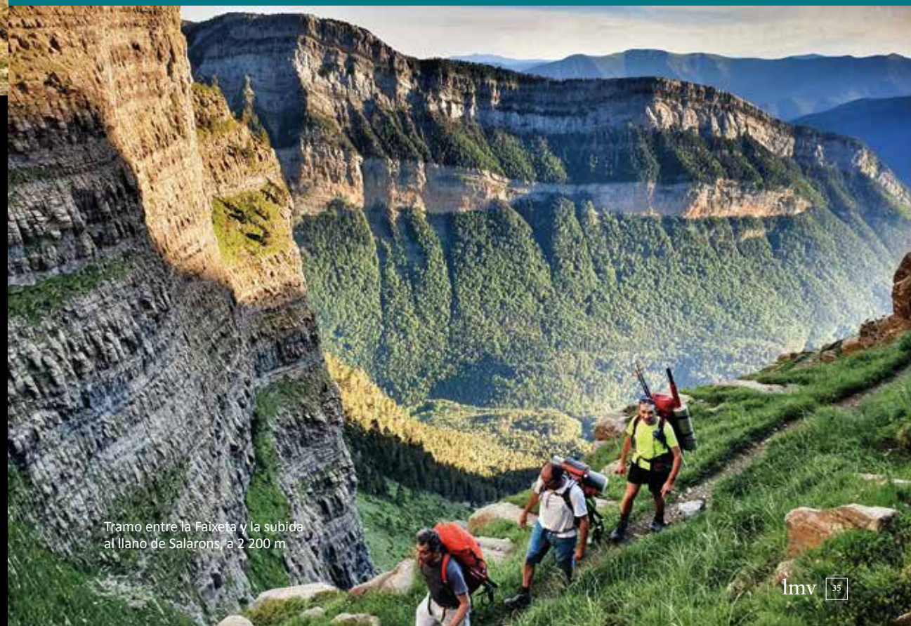
Tramo entre la Faixeta y la subida al llano de Salarons, a 2 200 m

rando fuerzas y disfrutando de las vistas panorámicas del valle, apreciando la valiosa y frágil flora que crece al abrigo de la faja y la presencia de aves de alta montaña como el treparriscos o el acentor alpino, la chova piquigualda o el gorrión alpino, además del vuelo de las grandes rapaces que dominan esos cielos, como el buitre leonado, el alimoche o el quebrantahuesos.