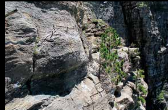
Arriba, el circo de Cotatuero desde la Faja de las Flores; abajo, paso de las clavijas de Cotatuero.

Iniciamos el descenso al valle siguiendo el sendero de Cotatuero. Nos dirigimos hacia la cascada o Churro de Cotatuero que, con sus 200 m de caída, es una de las mayores de la península Ibérica. Llegamos así al paso de las clavijas instaladas en 1881 para dar superar la parte alta del circo de Cotatuero. Es uno de los pasos más expuestos y peligrosos que encontraremos en los senderos señalizados del Parque Nacional de Ordesa y Monte Perdido. Como hemos comentado, la experiencia y el equipamiento adecuado son fundamentales para superarlo con seguridad. Es obligado equiparse adecuadamente (arnés, cabo de anclaje con disipador y casco) y asegurarse a la sirga de acero instalada a lo largo de todo el paso, junto a las históricas clavijas. En sus dos extremos cuenta con anclajes para poder realizar rápeles de socorro (20 m). Es un tramo en el que caminaremos entre barrones de hierro sobre el vacío, a descartar sin duda con mal tiempo.