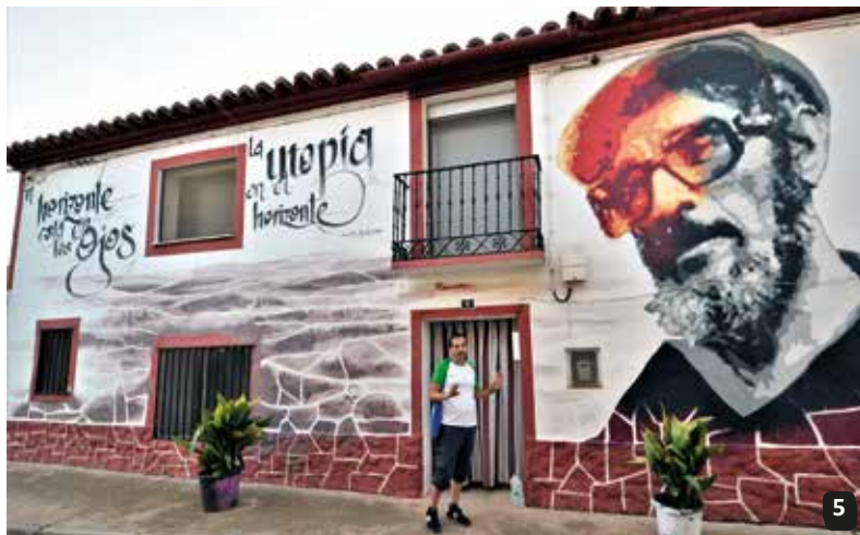
5. En Alfamén nació Manuel Pérez (1943-1998), sacerdote que terminó siendo el líder guerrillero del ELN en Colombia. Mural homenaje en la calle que lleva su nombre, frente a su casa natal.

A 445 m de altitud, en una planicie del somontano ibérico, en la comarca del Campo de Cariñena, se encuentra Alfamén, el pueblo de los “venas”. Este es el apelativo cariñoso (y de no fácil interpretación) que reciben sus habitantes, algo más de 1.400 en el censo de 2021. Incluso en la búsqueda del significado de este curioso apodo, tenemos la tentación de pensar en las aguas subterráneas que abundan en el subsuelo: los hidrogeólogos las han bautizado como el “acuífero de Alfamén”. Y son, ciertamente, uno de sus recursos más importantes, ya que no hay ríos o cauces destacados en la zona, a excepción de algunas ramblas que, esporádicamente, llevan sus aguas hacia el Jalón. Es pueblo eminentemente agrícola en el que se cultivan cereales, viñas, frutales y unas famosas sandías.