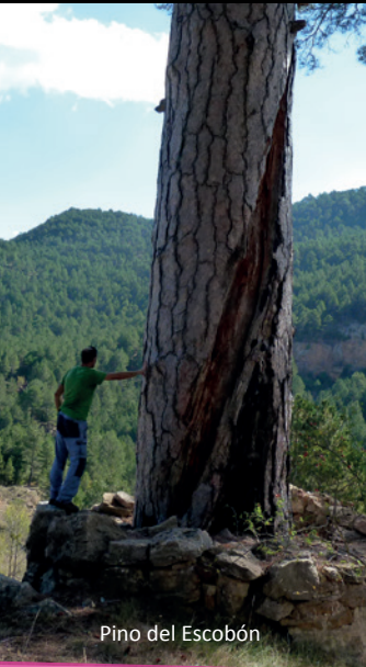
Pino del Escobón

La localidad de Linares de Mora bien merece una visita relajada y tranquila. Su casco urbano, declarado conjunto histórico-artístico es una maravilla y más todavía su magnífico paisaje natural, con enormes atractivos y pequeños rincones que descubrir. El sendero al pino “El Escobón” es un itinerario muy frecuentado en verano, se trata de la típica excursión senderista que realizan los habitantes al punto de la mañana con el fresco del verano. El inicio se realiza en el portal Alto, junto a la muralla. Se asciende por la zona nueva hasta tomar un sendero en dirección a la ermita de Santa Bárbara (PR-TE 29 en dirección a Valdelinares). El camino aparece bien delimitado con barandilla de madera y ofrece buenas vistas del valle del río Linares y sus masías. Atrás queda la silueta del castillo de Linares de Mora, sobre un pequeño promontorio. El camino desciende poco a poco junto a un gran muro de piedra seca hasta un puente de hormigón, que nos ayuda a cruzar el río Linares. Al otro lado, se enlaza con una pista de tierra en buen