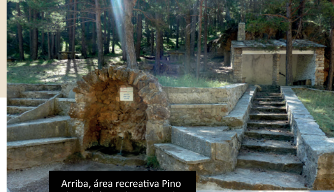
Arriba, área recreativa Pino El Escobón y, abajo, mirador starlight