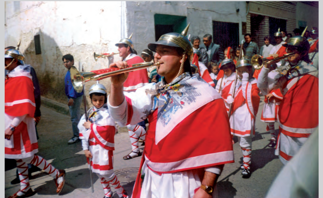
Cornetas y lanceros bajando por el Ferial