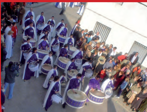
ABAJO Encuentro de la Amistad, Azuara 2005. Agrupa a las cofradías de Azuara, Mediana de Aragón, Belchite, Lécera, Letux, Moyuela y Almonacid de la Cuba. Procesión del Santo Entierro. Alabarderos llegando a la hoguera del barrio Bajo

Afortunadamente, este grupo de alabarderos forma parte de una tradición arraigada que se ha transmitido de generación en generación y que ha logrado superar momentos verdaderamente difíciles. Los alabarderos de Azuara son un componente distintivo de la Semana Santa de la villa, y la hacen diferente a la de otras localidades. Son una parte importante de la Semana Santa azuarina, de esos ritos y tradiciones que logran mantener viva la identidad de un pueblo.