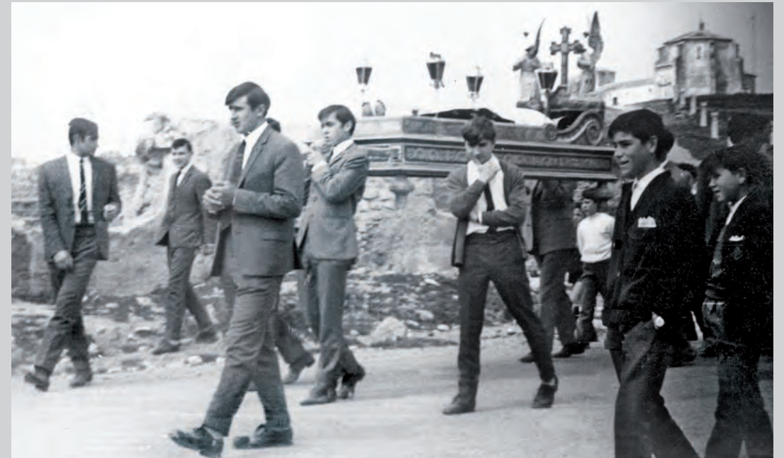
Camá de Nuestro Señor cerrando la procesión en la mañana del Viernes Santo

En la mañana del Viernes Santo, a eso de las doce, se sale desde la iglesia al ritmo del paso ligero hasta el comienzo del viacrucis, parando en cada una de sus catorce estaciones, ubicadas en la empinada cuesta que da acceso a la ermita de San José. Una vez llegados al calvario, se cogen los pasos que esperan en el interior de la ermita y en procesión son llevados hasta la iglesia. Las gentes salen de sus casas al encuentro de la comitiva.