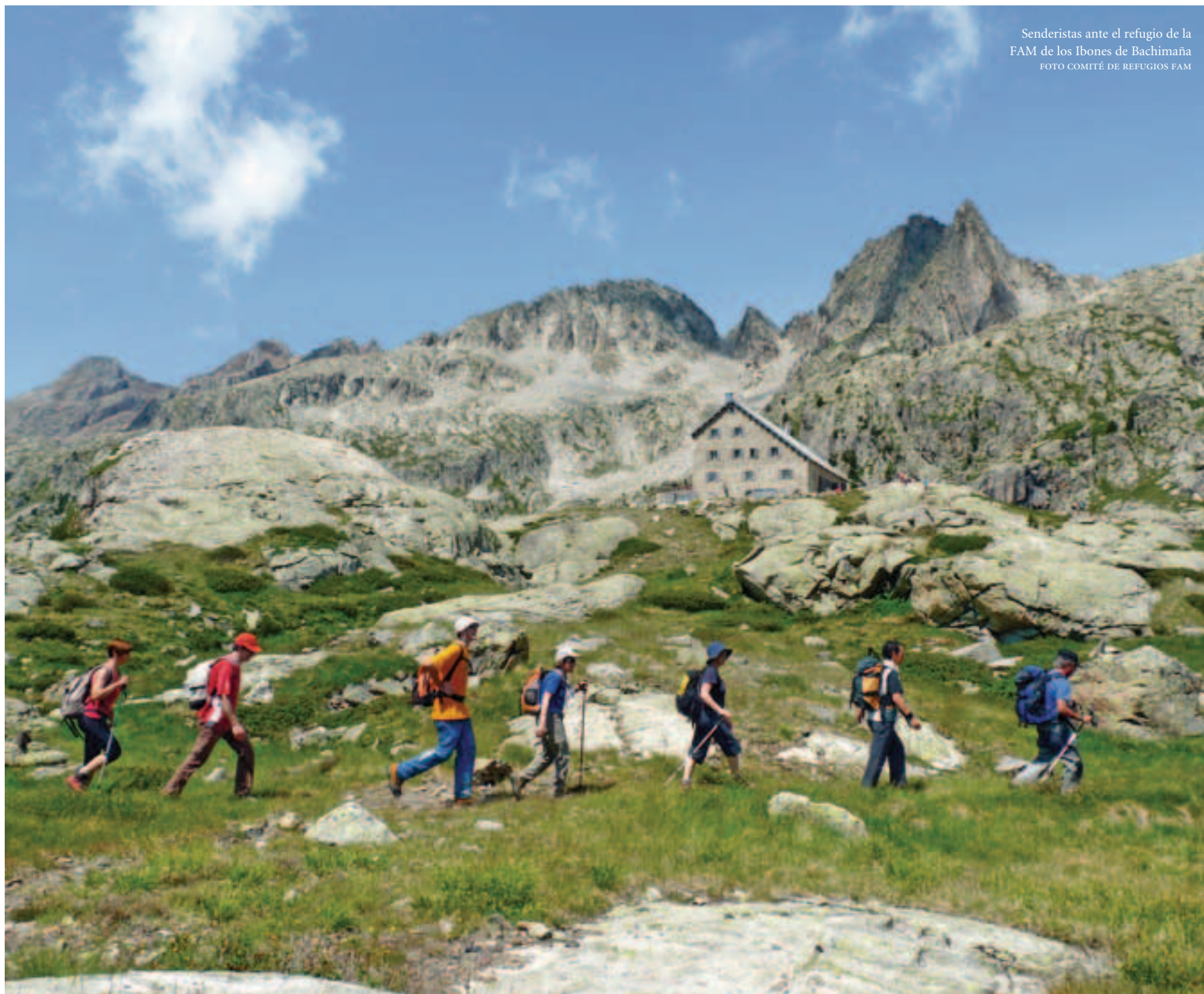
Senderistas ante el refugio de la FAM de los Ibones de Bachimaña