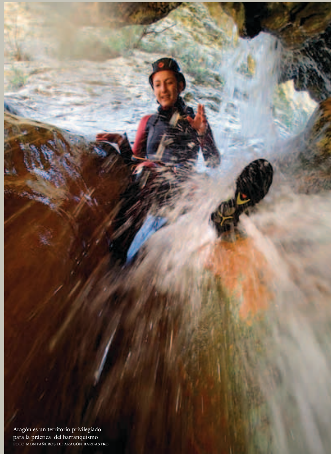
Aragón es un territorio privilegiado para la práctica del barranquismo