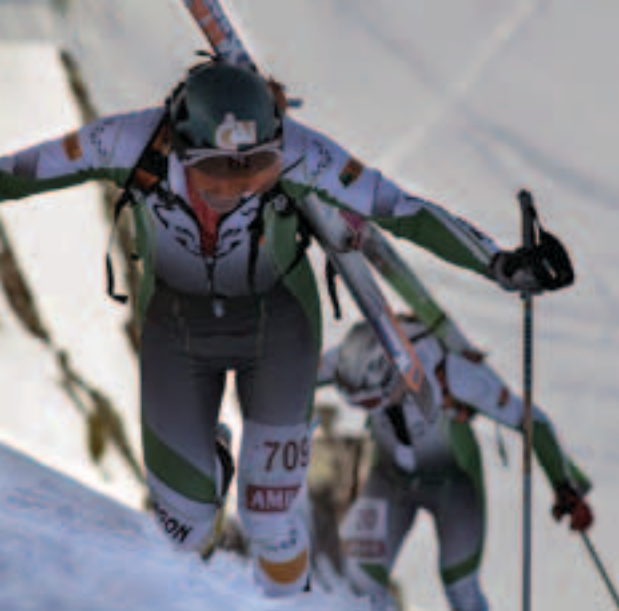
Participantes de la FAM en una prueba de esquí de montaña

Todos hemos oído contar en las noches de tertulia, en los refugios aquellos, viajes increíbles en moto a Chamonix o al Pirineo para hacer una escalada o una travesía con esquís, largo tiempo soñada, y regresar presurosos a casa para incorporarse al trabajo con el tiempo justo. Con unos materiales y equipamientos que, al verlos, hoy nos hacen sonreír y admirar especialmente esas grandes gestas deportivas de aquellos pioneros que hace tantos años apostaron por hacer del montañismo uno de los deportes más emblemáticos de Aragón. Un deporte que hoy en día, y gracias al trabajo de muchos montañeros y a la colaboración de las diferentes administraciones, cuenta en nuestra comunidad autónoma con unas infraestructuras muy importantes, como son la red de refugios y senderos, muros de escalada y vías ferratas, publicaciones y topoguías, etc. Infraestructuras que ayudan a la práctica deportiva y potencian todo tipo de actividades turísticas y lúdicas en torno al medio natural. Y que, sin duda, ayudan a dinamizar social y económicamente las zonas de montaña de nuestra comunidad, convirtiéndose en un motor económico que funciona de manera constante y respetuosa, y que valora todas y cada una de nuestras singularidades. Tanto es así que estamos representados en todos los Espacios Naturales Protegidos de nuestra comunidad con voz propia.