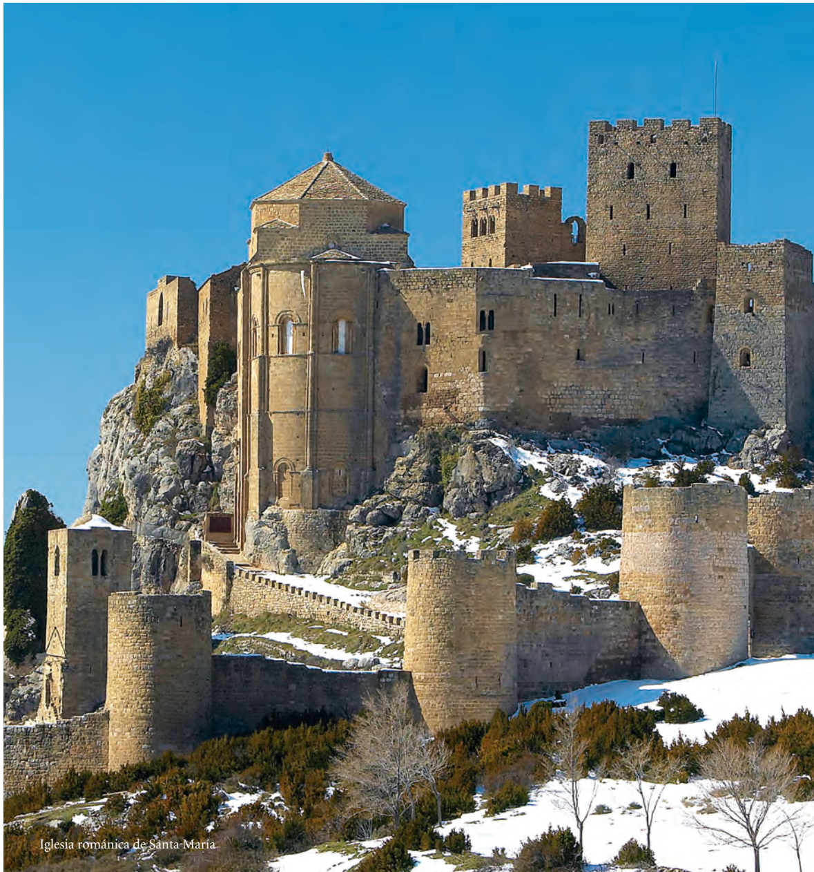
Iglesia románica de Santa María

Loarre es el castillo románico mejor conservado de España y la fortaleza real más antigua, lo que la sitúa también entre las principales de Europa. Su buen estado de conservación y su emplazamiento como espectacular mirador del Prepirineo sobre la Hoya de Huesca lo han convertido también en un valorado plató cinematográfico. El escaso protagonismo militar que tuvo en su época y un temprano abandono han facilitado la preservación de esta joya de la historia, emblema de los castillos de Aragón.