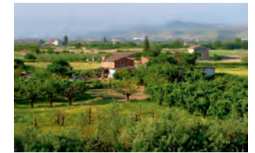
Entorno de Fraga