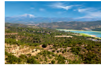
La Puebla de Castro

(Estrabón, en Guillermo Fatás, Antología de textos para el estudio de la antigüedad en el territorio del Aragón actual , DGA, 1993.)