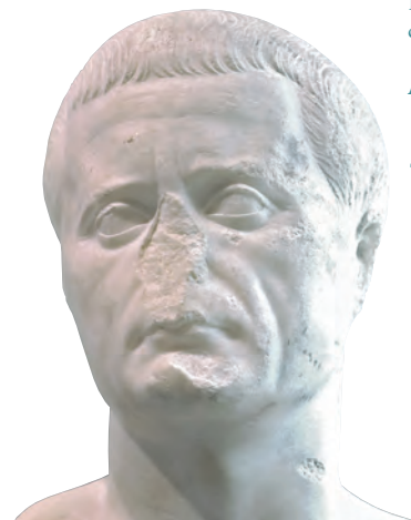
Busto anónimo. Museo de Zaragoza