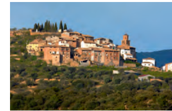
Coscojuela de Fantova