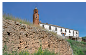
Santuario de la Virgen del Pueyo y restos de lo que pudo ser Belgeda