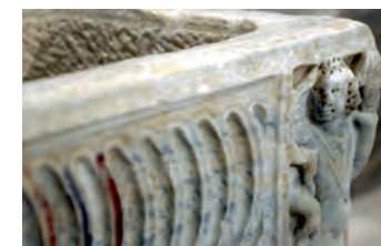
Exposición permanente Arqueología del Moncayo. Tarazona