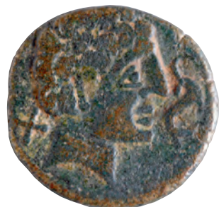
Moneda ibérica procedente de Hinojosa de Jarque. Museo de Zaragoza