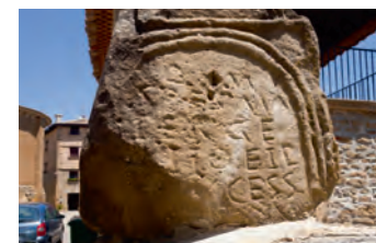
Inscripción de un enterramiento procedente de Los Bañales