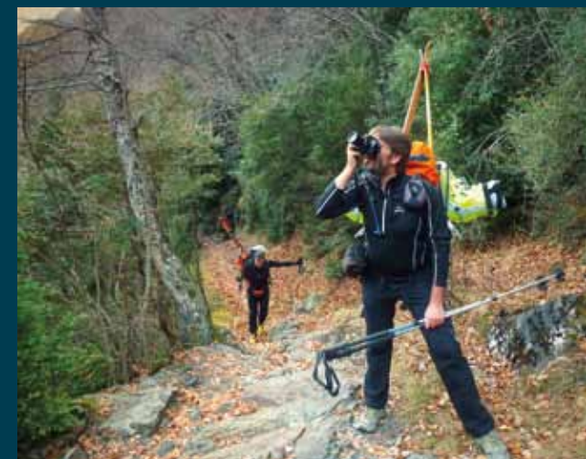
En la parte inicial de la senda

Ascenso desde el parquin. Continuaremos a pie por la pista unos 200-300 m y pasaremos enfrente de la cascada de Espigantosa. Llegaremos al puente de la Espigantosa, donde la pista termina y pasa a sendero. La senda es amplia y no tiene pérdida. Está jalonada por marcas de PR (blancas y amarillas). Un cartel marca al frente la ruta S4/PR-36 («Refugio Ángel Orús-Forcau, 1 h 30 min»). El camino amplio empieza por la margen izquierda y pronto cruza a la margen derecha