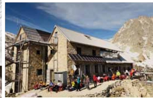
Refugio Ángel Orús