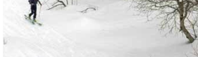
ARRIBA Entrando en el llano de la Pleta de Riberetes ABAJO Iniciando la suave diagonal antes del repecho final