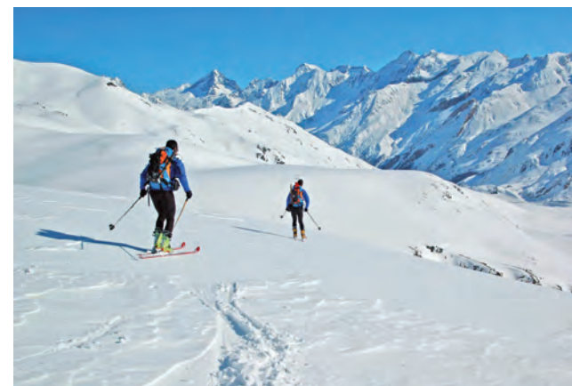
Descendiendo el puerto de Astún

Una vez en la D934 nos dirigimos al aparcamiento que hay junto al paso fronterizo (WP N° 11) desde el que nos encaminamos en dirección SE pasando por detrás,