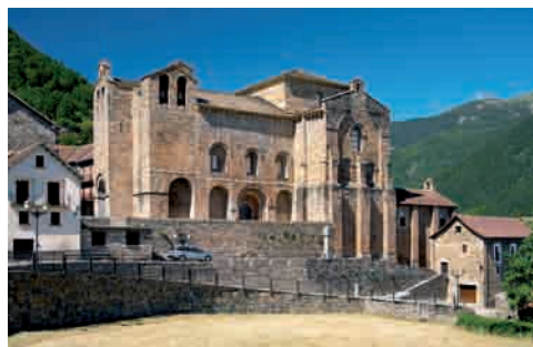
Iglesia de San Pedro de Siresa

UNA MENCIÓN ESPECIAL HAY QUE HACER POR SU VINCULACIÓN CON LA RUTA JACOBEO DE LA CATEDRAL DE SAN PEDRO, UNO DE LOS EMBLEMAS DEL ROMÁNICO ESPAÑOL. AUNQUE HA SUFRIDO DISTINTAS REFORMAS POSTERIORES, DE ESTA ÉPOCA DATA LA PORTADA, DONDE SE CONJUGAN ELEMENTOS DECORATIVOS PROPIOS QUE INFLUYERON EN EL ROMÁNICO POSTERIOR. EL CRISMÓN TRINITARIO DEL TÍMPANO ES UNA PIEZA CLAVE DE LA RUTA JACOBEO.