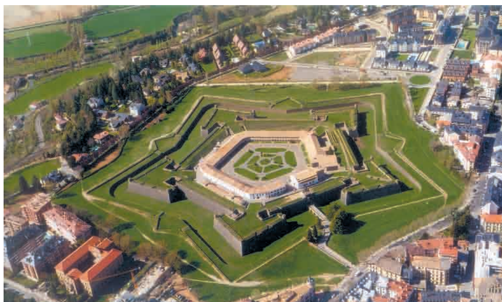
Vista aérea de la Ciudadela de Jaca

HASTA EL NOMBRE MUESTRA LA VINCULACIÓN DE LA LOCALIDAD CON EL CAMINO DE SANTIAGO, PASO PARA UNA VARIANTE DE LA RUTA POR ARAGÓN ACTUALMENTE EN ESTUDIO.