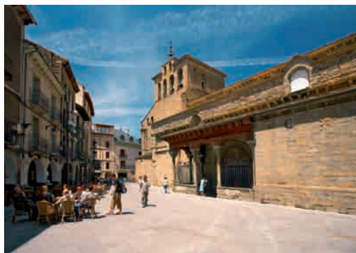
Vista de la catedral de Jaca