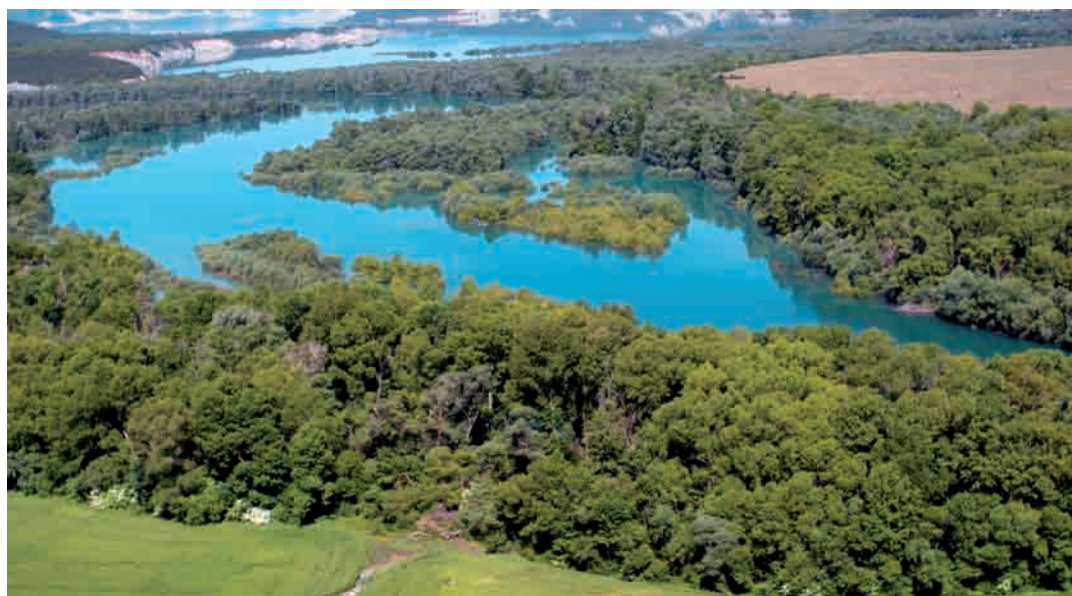
Vista aérea del embalse de Yesa

DESDE AQUÍ, EL ITINERARIO CLÁSICO CONTINÚA, EN DOS NUEVAS ETAPAS, A MONREAL Y PUENTE LA REINA, DONDE ENTRONCA CON LOS OTROS CAMINOS QUE CRUZABAN EL PIRINEO. LA CATEDRAL DE SANTIAGO, META DE TODA LA RED, ESTÁ A 27 DÍAS DE MARCHA.