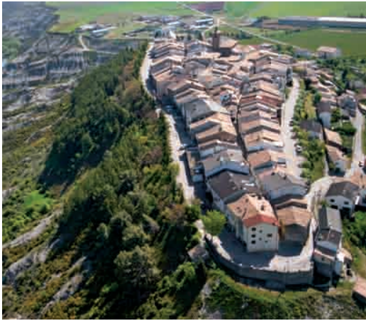
Vista aérea de Berdún