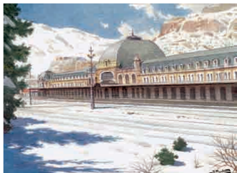
Antigua estación de Canfranc

EL GRAN MOJÓN DE LA MISMA LÍNEA FRONTERIZA SE CONSTRUYÓ PARA CONMEMORAR LA INAUGURACIÓN DE LA CARRETERA; PERO LA ANTIGUA VÍA MEDIEVAL, EXCAVADA EN LA ROCA, SIGUE AGUARDANDO AL LADO AL PEREGRINO PARA INICIAR EL CONTINUADO DESCENSO (DE 1.632 A 818 M) QUE LLEVA HASTA JACA. AUNQUE EN ALGÚN TRAMO HAY QUE CRUZAR EL ASFALTO, TODO EL SABOR ORIGINAL DE LA RUTA ESTÁ EN LA SENDA EMPEDRADA Y SU ENTORNO DE BOSQUES Y PRADOS.