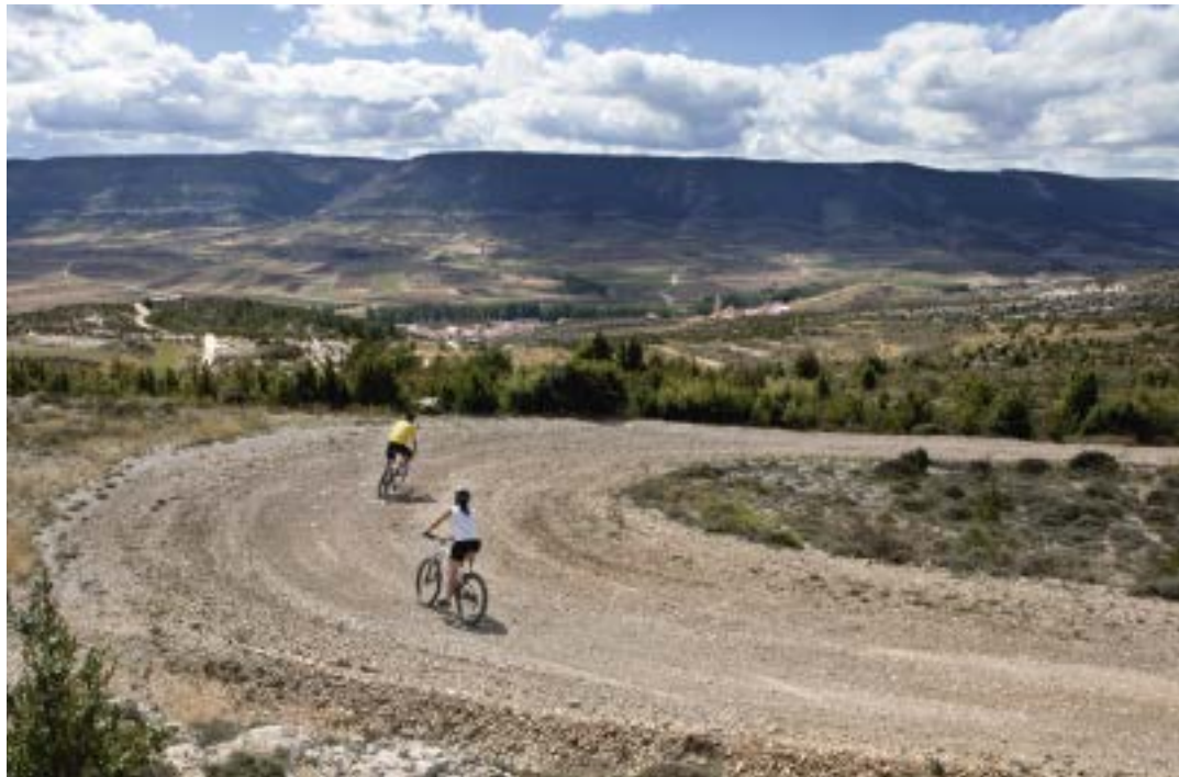
Panorámica de Peñacerrada y valle de Fortanete desde la ruta 1