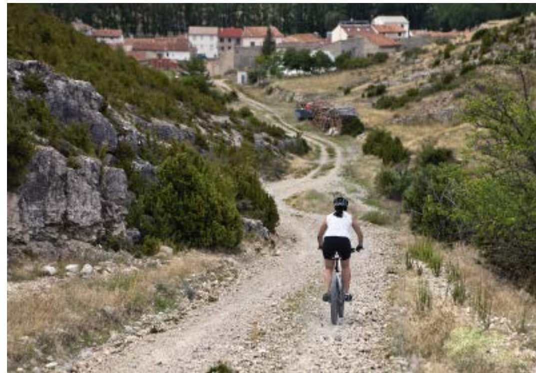
Descenso final a Fortanete

pellanía. La sima de la Rama o «la Cija», como se le conoce en este lugar, se localiza en término de Cañada de Benatanduz, y se trata de la cavidad más profunda de la provincia de Teruel, con 113 metros de desnivel. Otro de los atractivos de este relieve es, sin duda, su carácter montano que actúa como mirador natural: desde el peirón de los Santos Adones hasta el vértice geodésico de la Capellanía podemos recorrer la línea de cumbre en BTT, acortando la ruta considerablemente. Se trata de un lugar de interés geológico (LIG) que engloba otras formaciones menores de gran importancia.