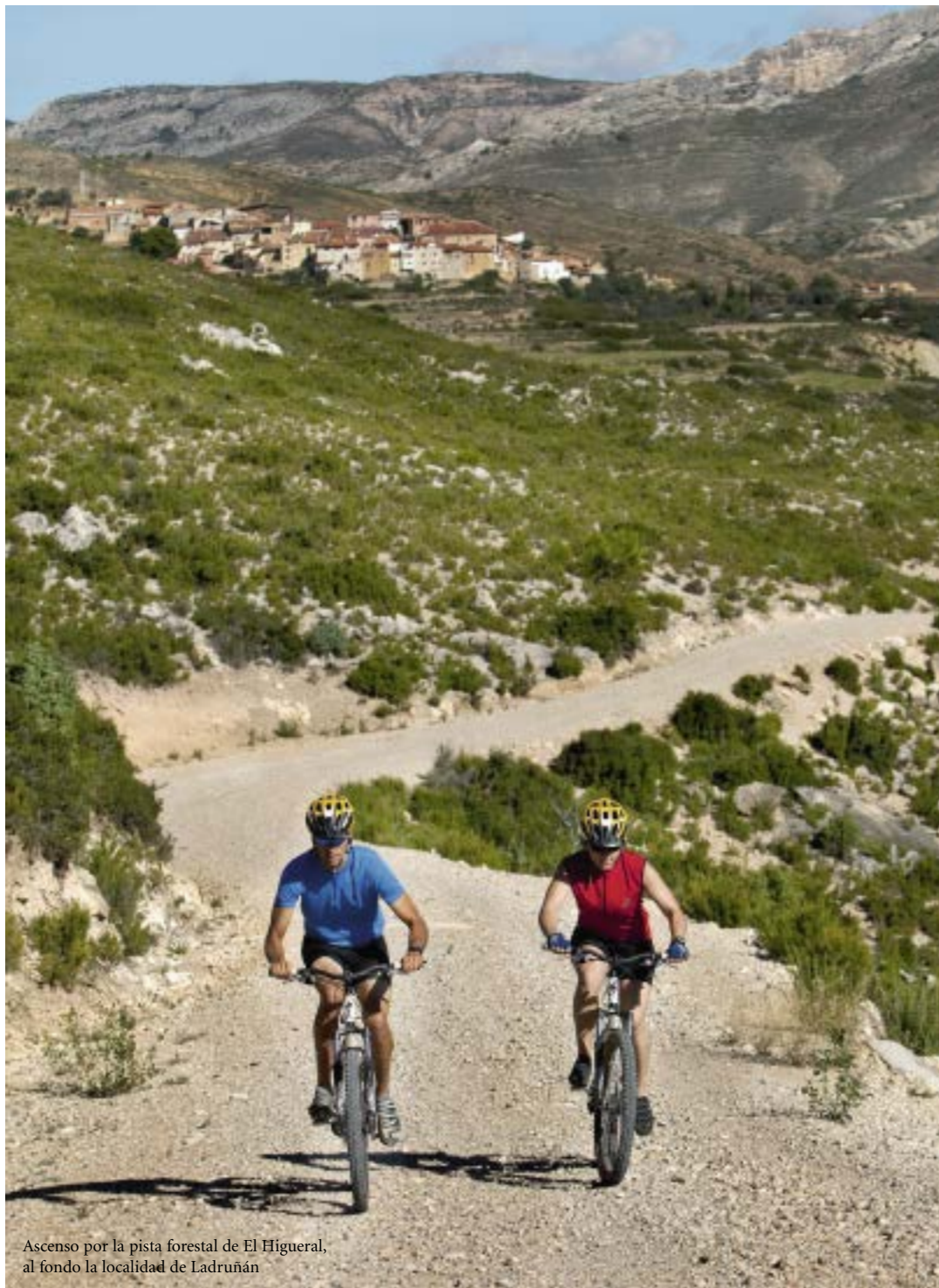
Ascenso por la pista forestal de El Higueral, al fondo la localidad de Ladruñán