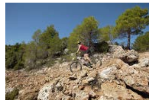
Descenso hacia el puente del Vado

Débil cobertura de móvil. Precaución en cortados rocosos y descensos.