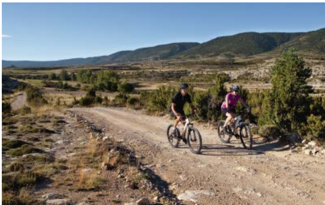
Partida de Mercadales, Fortanete (rutas 1 y 3)

Formada por un pliegue geológico –anticlinal– hace millones de años, la sierra de la Cañada es una desconocida para el viajero. Entre sus espesos pinares, se esconden gratas sorpresas que no deben pasar desapercibidas para el ciclista. Sus laderas albergan singulares ejemplares de pino silvestre, a más de 1.700 metros de altitud, acompañados de sabina rastrera, abundante boj y enebros. El Castillo del Cid se esconde también sobre un farallón rocoso dominando la partida de Mercadales, en la ladera oeste de la sierra. Para acceder hasta este lugar nos debemos de desviar de la ruta BTT y continuar andando por un sendero de pequeño recorrido (PR) que se inicia en las cercanías de la masía de la Ca-