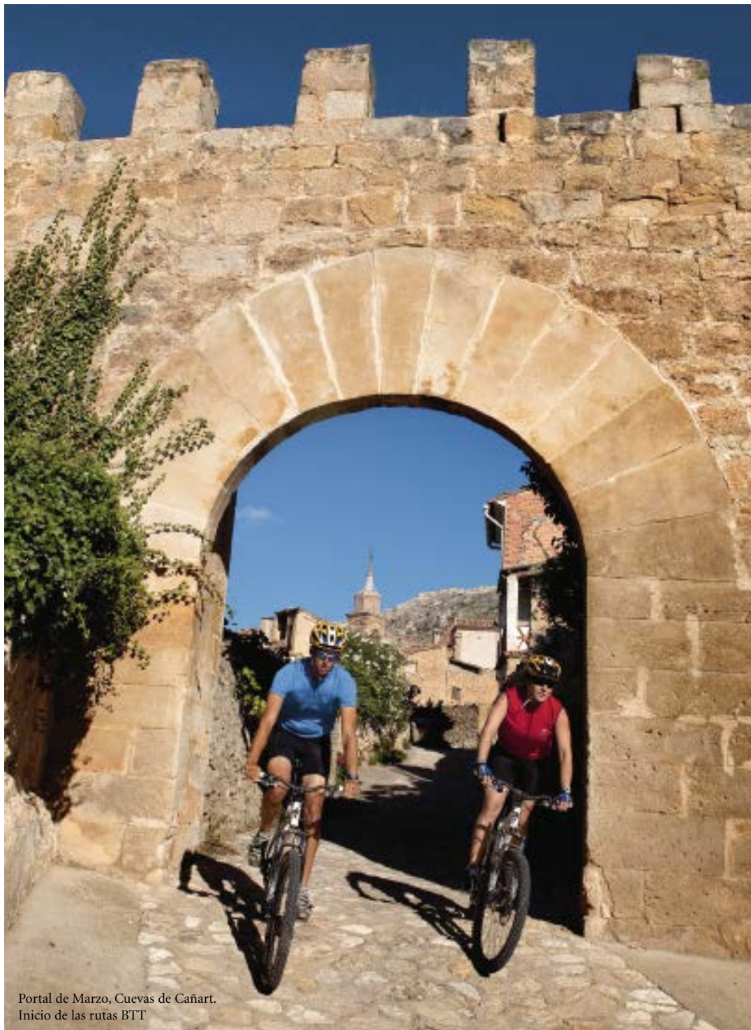
Portal de Marzo, Cuevas de Cañart. Inicio de las rutas BTT