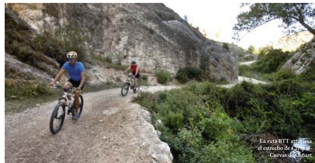
La ruta BTT atraviesa el estrecho de Crespol-Cuevas de Cañart