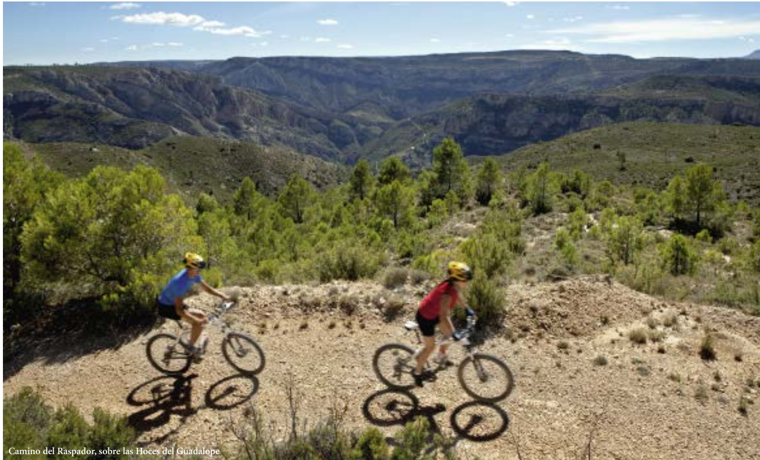
Camino del Raspador, sobre las Hoces del Guadalupe