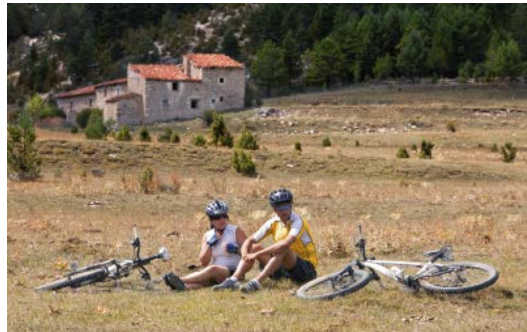
A lo largo de las rutas también hay momentos para relajarse