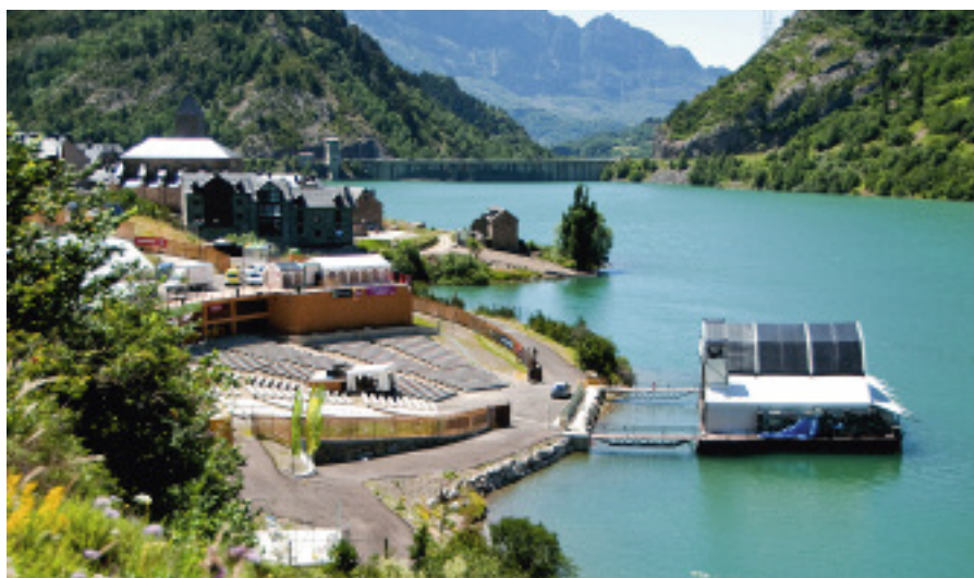
Auditorio natural de Lanuza

Y si Pirineos Sur es importante en el plano musical, lo es todavía más por la influencia que tiene sobre el turismo de la zona y su repercusión económica. Es una clara apuesta para potenciar el turismo cultural en la provincia de Huesca y, más concretamente, en las comarcas del valle de Tena y del Serrablo. Un reciente estudio de la Universidad de Zaragoza señalaba que, de media, un visitante del festival se gasta 150 euros en la zona durante su estancia.