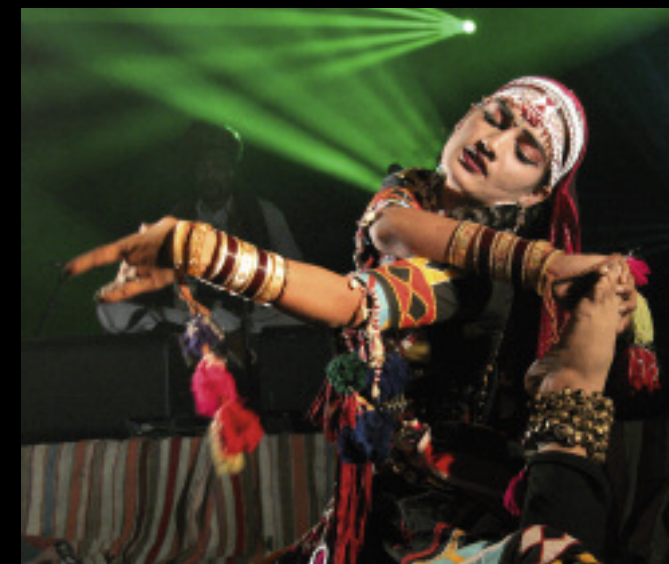
Dhoad Gipsy Rajasthan