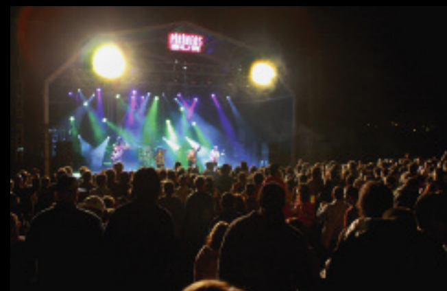
Dirty Dozen Brass Band