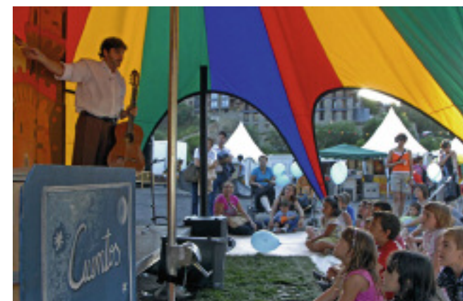
Distintos talleres y actividades que completan el día en el festival Pirineos Sur

Además de los conciertos, ofrece talleres, actividades infantiles, animación, cine y otra serie de programas relacionados con la diversidad cultural, los mercados del mundo, una cincuentena de expositores con artesanía, discos o ropa y restaurantes con cocinas de cuatro continentes.