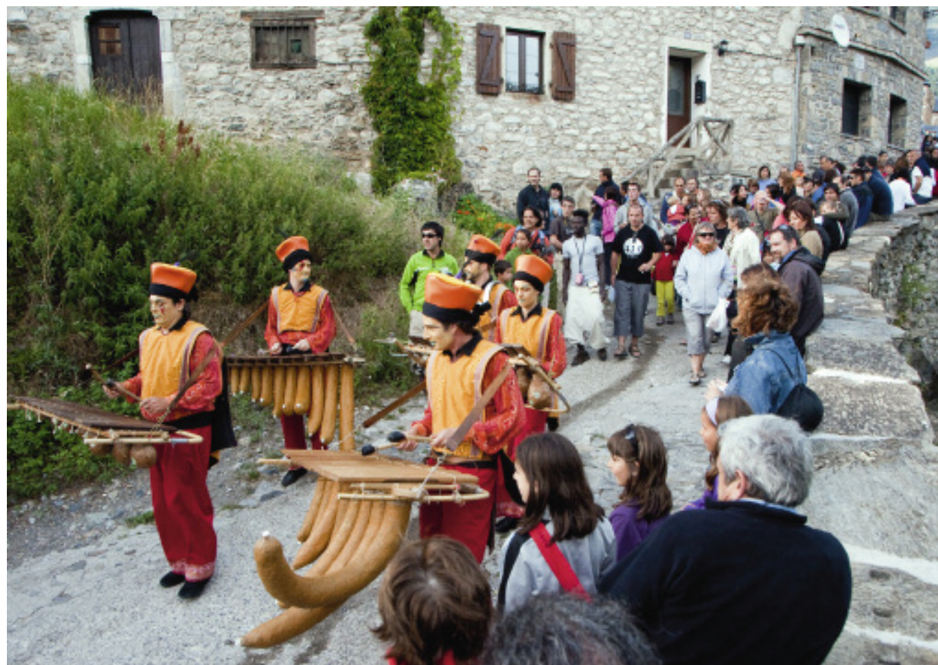
Animación en las calles de Sallent de Gállego