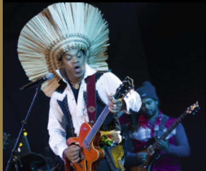
Carlinhos Brown

También actuaron Rubén Blades y Manu Dibango.