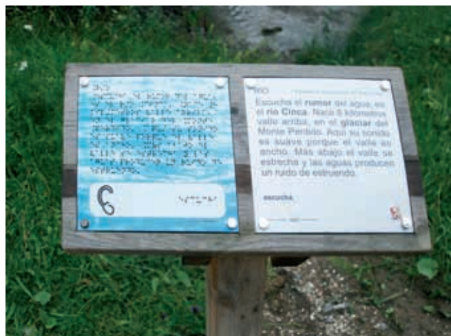
Equipamiento. Sendero en el valle de Pineta

Estas dos rutas no suponen más que el inicio de un reto que está presente en muchos puntos de destino concretos; pero la Diputación Provincial de Huesca no duda de que si se quiere un futuro distinto al actual en el ocio, hay que ser capaces de sentir, pensar y hacer desde y para todas las personas.