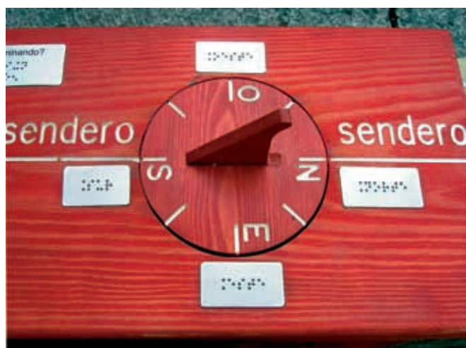
Sendero equipado en el valle de Pineta